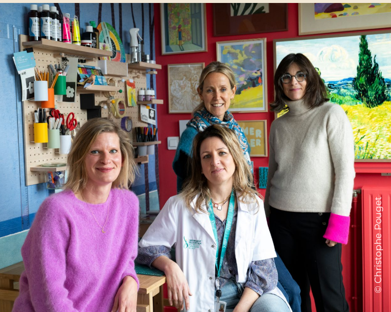
Inauguration de la Capsule de St Vincent de Paul